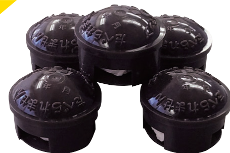
殺虫力比較データ