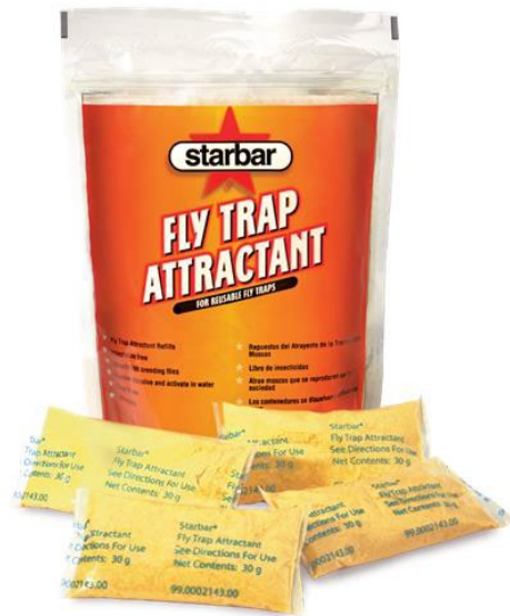
梱包単位 12 パック