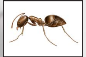
アルゼンチンアリ