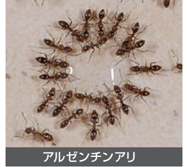
アルゼンチンアリ