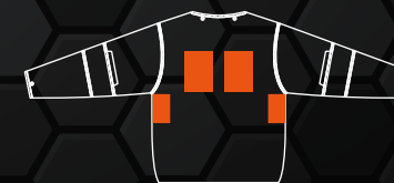
保冷剤専用ポケット位置

メッシュライナーに冷やした保冷剤を収納出来るポケットを4箇所配置。炎天下の作業をサポートします。