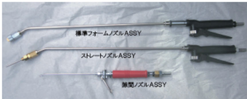
標準フォームノズルASSY