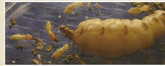
イエシロアリ(女王、働きアリ、兵隊アリ)

日本で建築物に大きな被害を与えるのはイエシロアリとヤマトシロアリの2種類です。前者は6月~7月の夕方頃に、後者はゴールデンウィーク前後の日中に羽アリが群飛します。これらのシロアリは湿気を好むため、浴室、台所、洗面所の土台、敷居、床組などあるいは雨漏りのある所が被害をよく受けます。さらにイエシロアリは巨大なコロニーを造ることができるので屋根裏まで被害が広がることがあります。