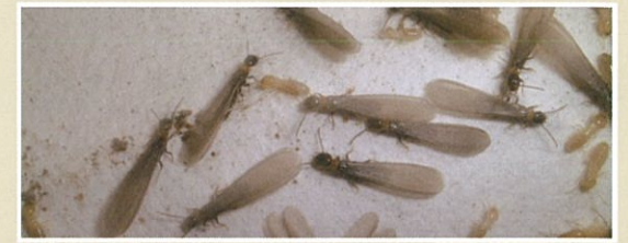
ヤマトシロアリ(羽アリ、働きアリ、兵隊アリ)