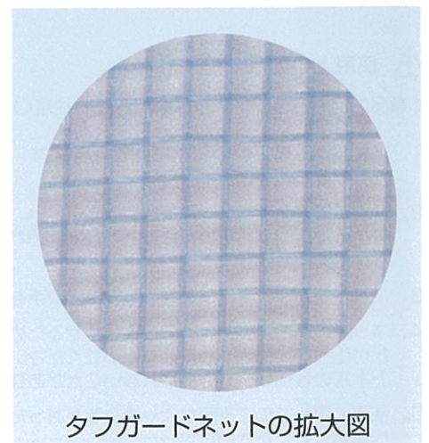
タフガードネットの拡大図