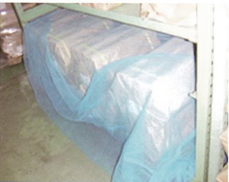
倉庫内の保管物の保護