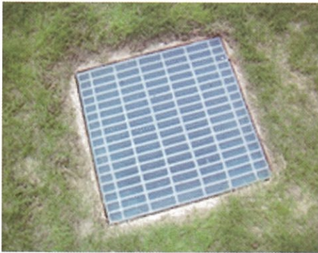
雨水枡やグレーチング