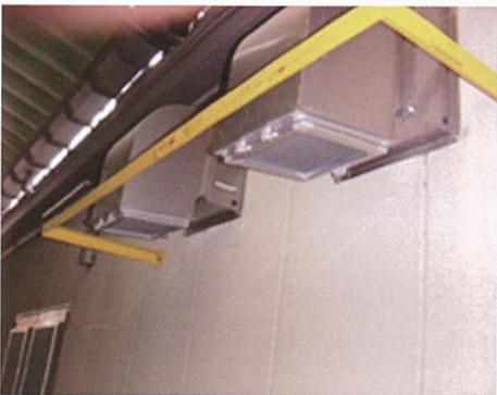
換気口からの侵入防止