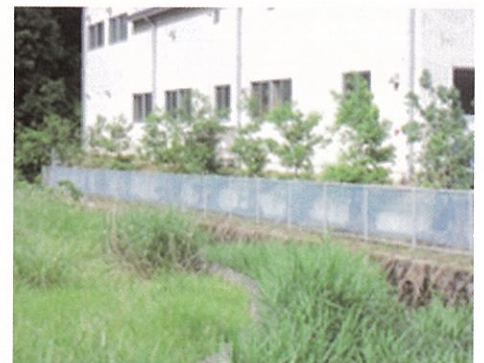
工場周辺のフェンス