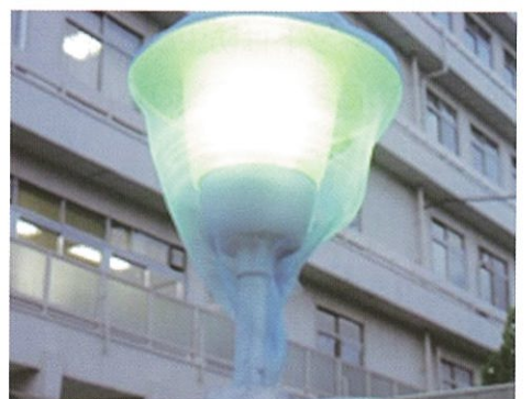
街灯を利用し殺虫