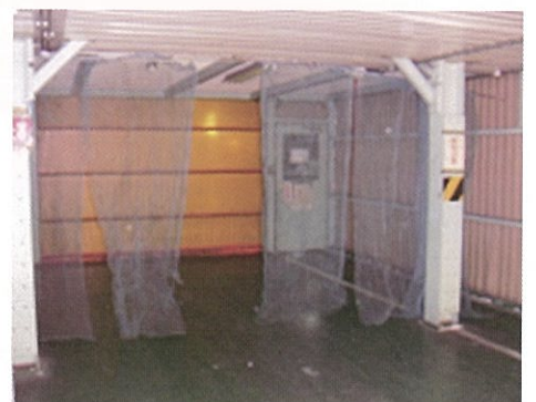
搬入出口からの侵入防止