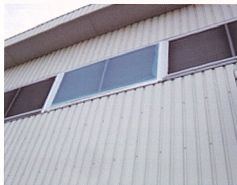
通気口からの侵入防止